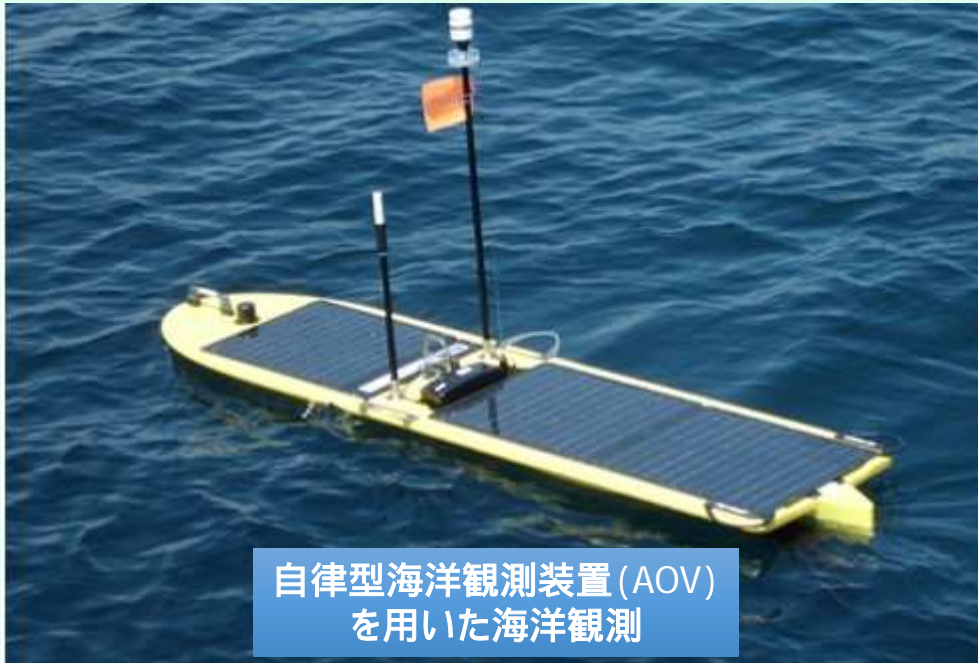
自律型海洋観測装置 (AOV) を用いた海洋観測