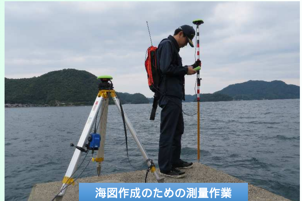
海図作成のための測量作業